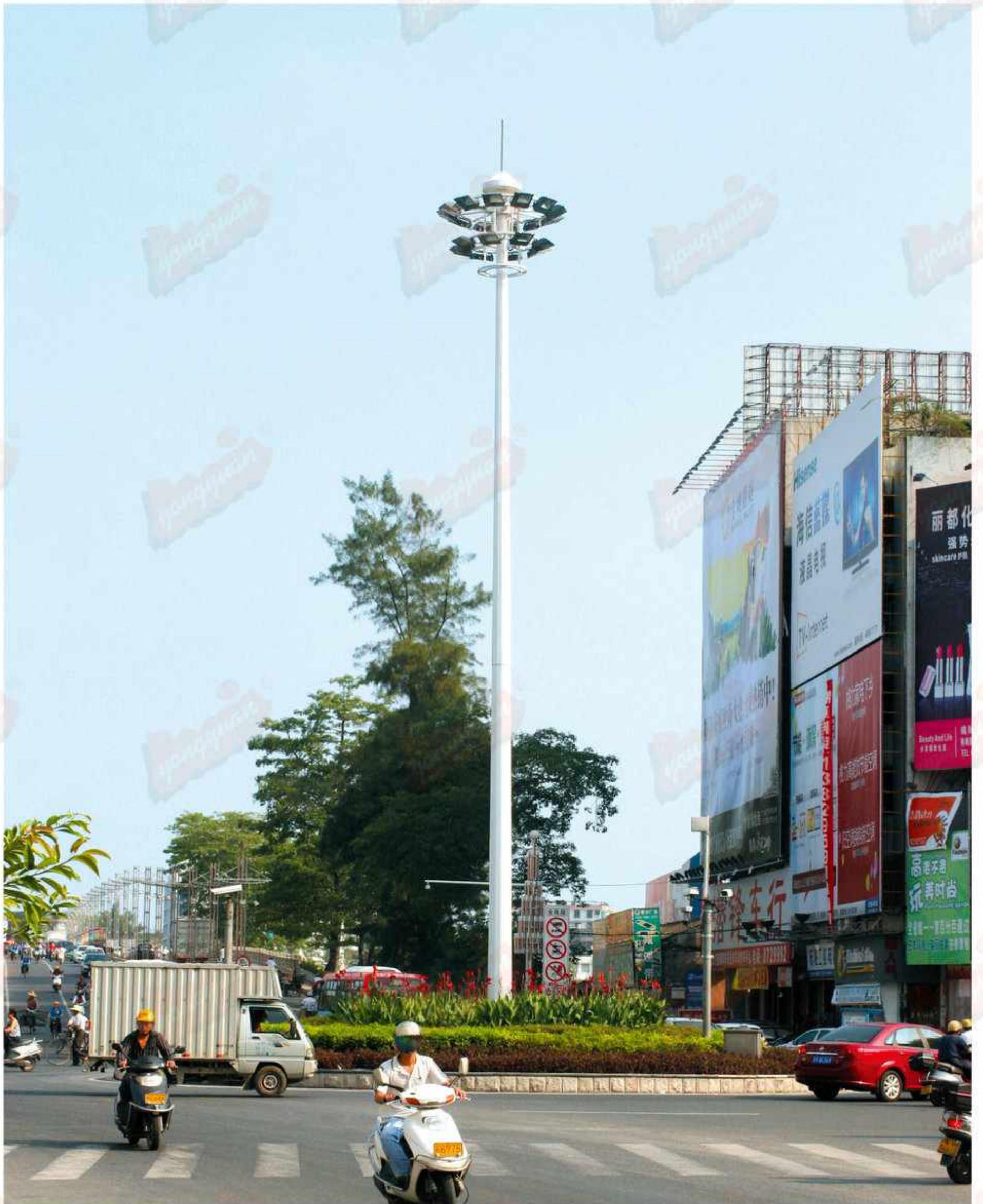
型号：永安名牌2019A16 技术参数：总高18-30m，钢铁制品；灯具铝制品，配400w-1000w高压钠灯，金卤灯或LED光源，全套内外热浸锌防腐处理后喷优质户外氟碳漆，配置高杆灯专用自动升降系统，配钢丝绳、电缆线、地基螺丝及提供安装技术指导，具体技术规范根据安装地域的抗风等级及地震烈度设防度的要求。