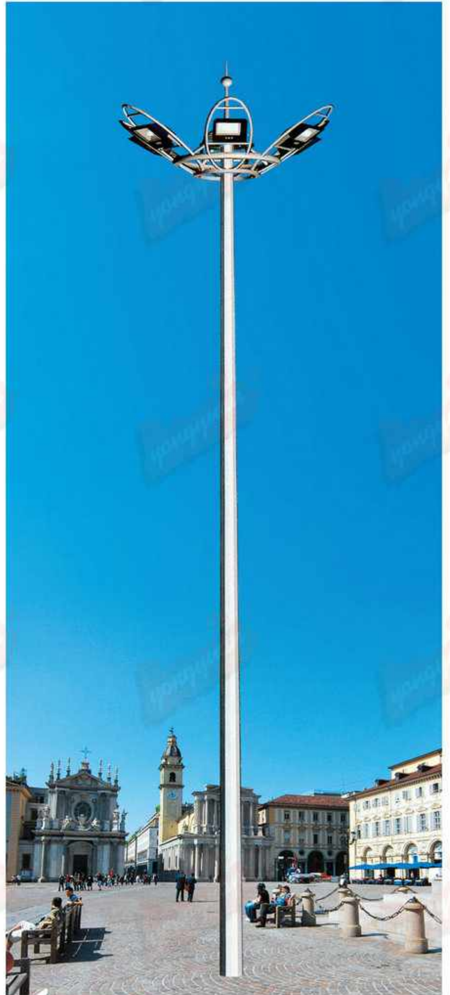
型号：永安名牌2019A53 技术参数：总高18-30m，钢铁制品；灯具铝制品，配400w-1000w高压钠灯，金卤灯或LED光源，全套内外热浸锌防腐处理后喷优质户外氟碳漆，配置高杆灯专用自动升降系统，配钢丝绳、电缆线、地基螺丝及提供安装技术指导，具体技术规范根据安装地域的抗风等级及地震烈度设防度的要求。