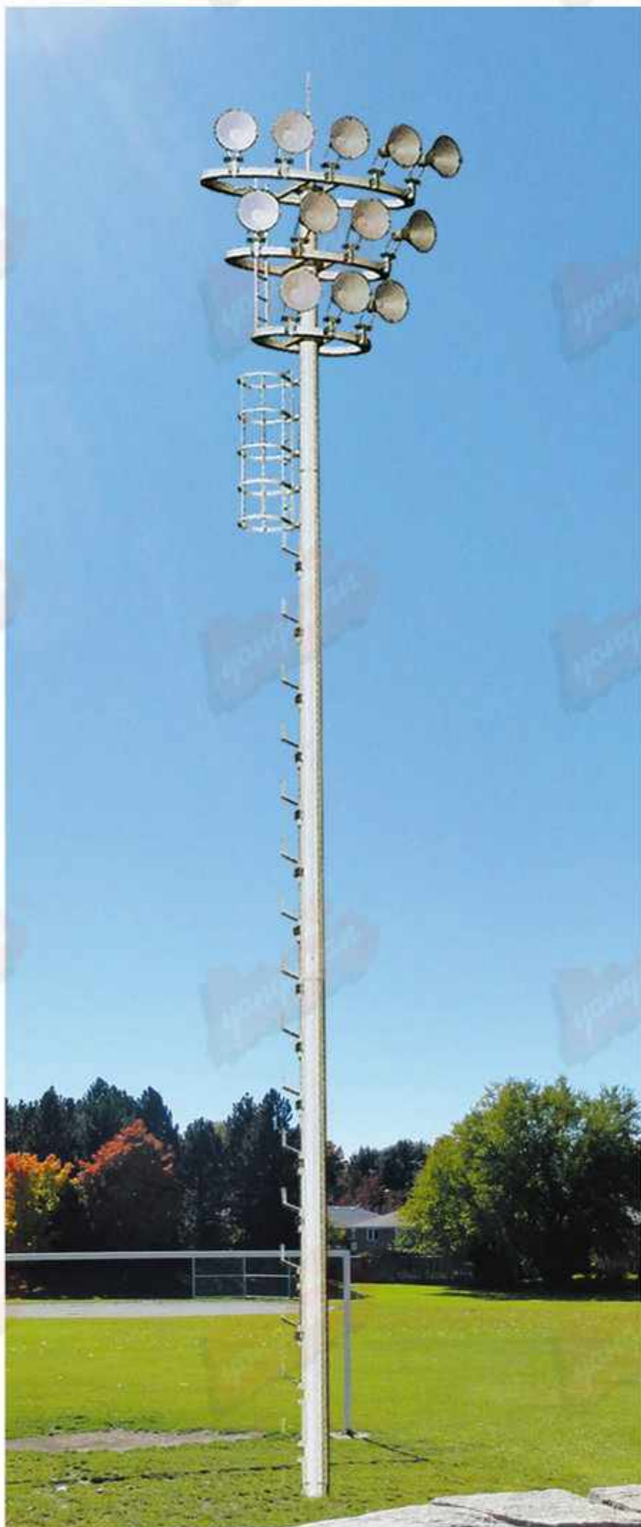
型号：永安名牌2019A54 技术参数：总高15-30m，钢铁制品；灯具铝制品，配400w-1000w高压钠灯，金卤灯或LED光源，全套内外热浸锌防腐处理后喷优质户外氟碳漆，具体技术规范根据安装地域的抗风等级及地震烈度设防度的要求。