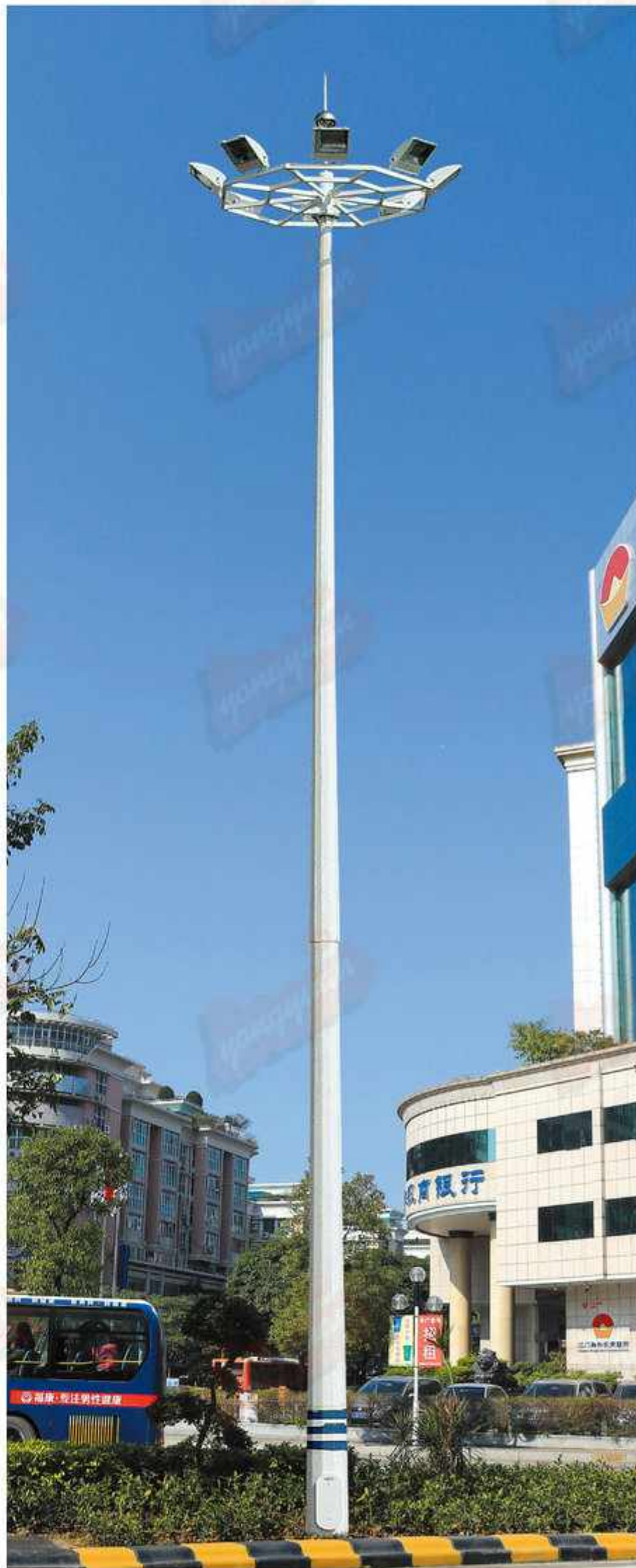
型号：永安名牌2019A22 技术参数：总高15-25m，钢铁制品；灯具铝制品，配400w-1000w高压钠灯，金卤灯或LED光源，全套内外热浸锌防腐处理后喷优质户外氟碳漆，具体技术规范根据安装地域的抗风等级及地震烈度设防度的要求。