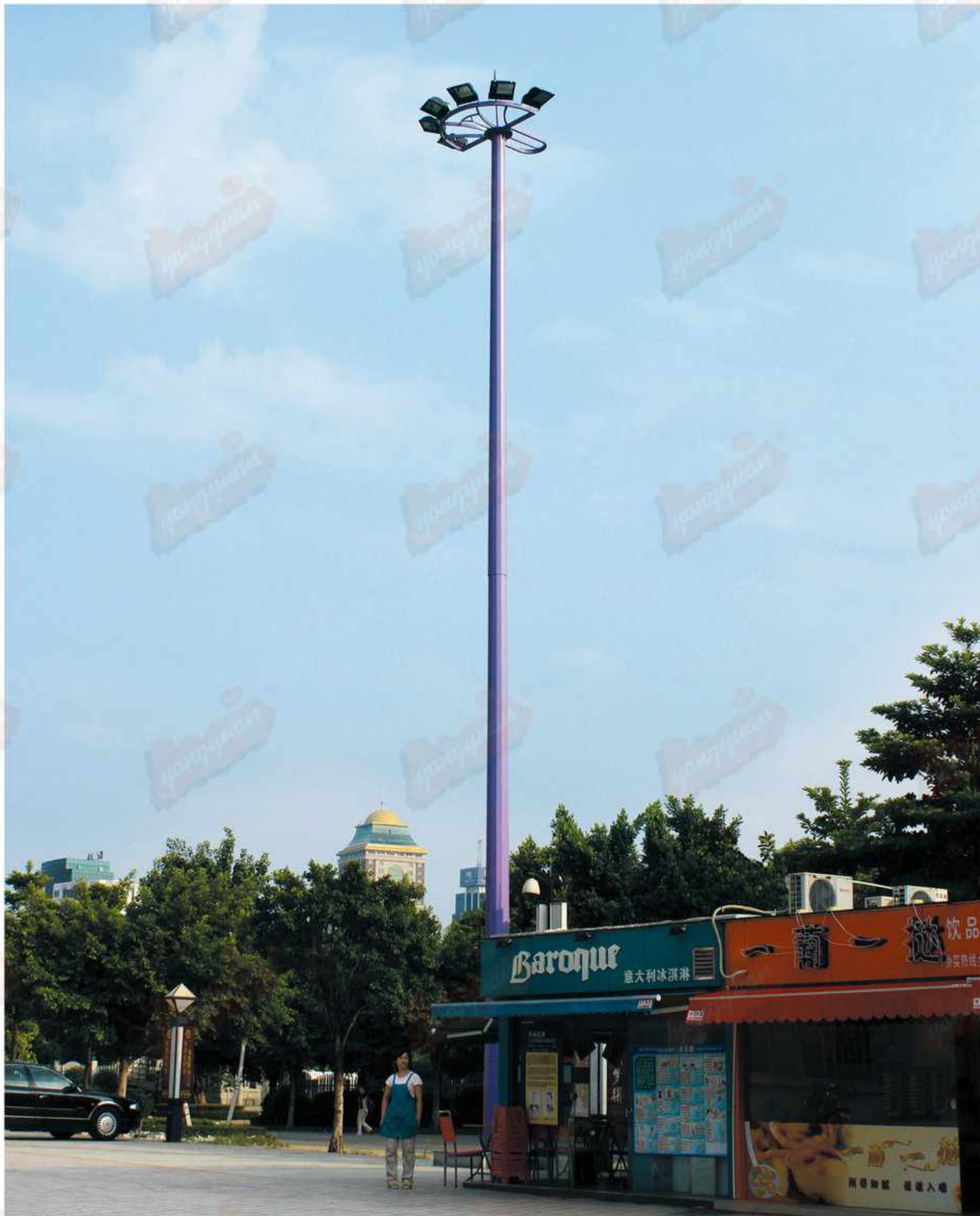
型号：永安名牌2019A59 技术参数：总高18-30m，钢铁制品；灯具铝制品，配400w-1000w高压钠灯，金卤灯或LED光源，全套内外热浸锌防腐处理后喷优质户外氟碳漆，具体技术规范根据安装地域的抗风等级及地震烈度设防度的要求。