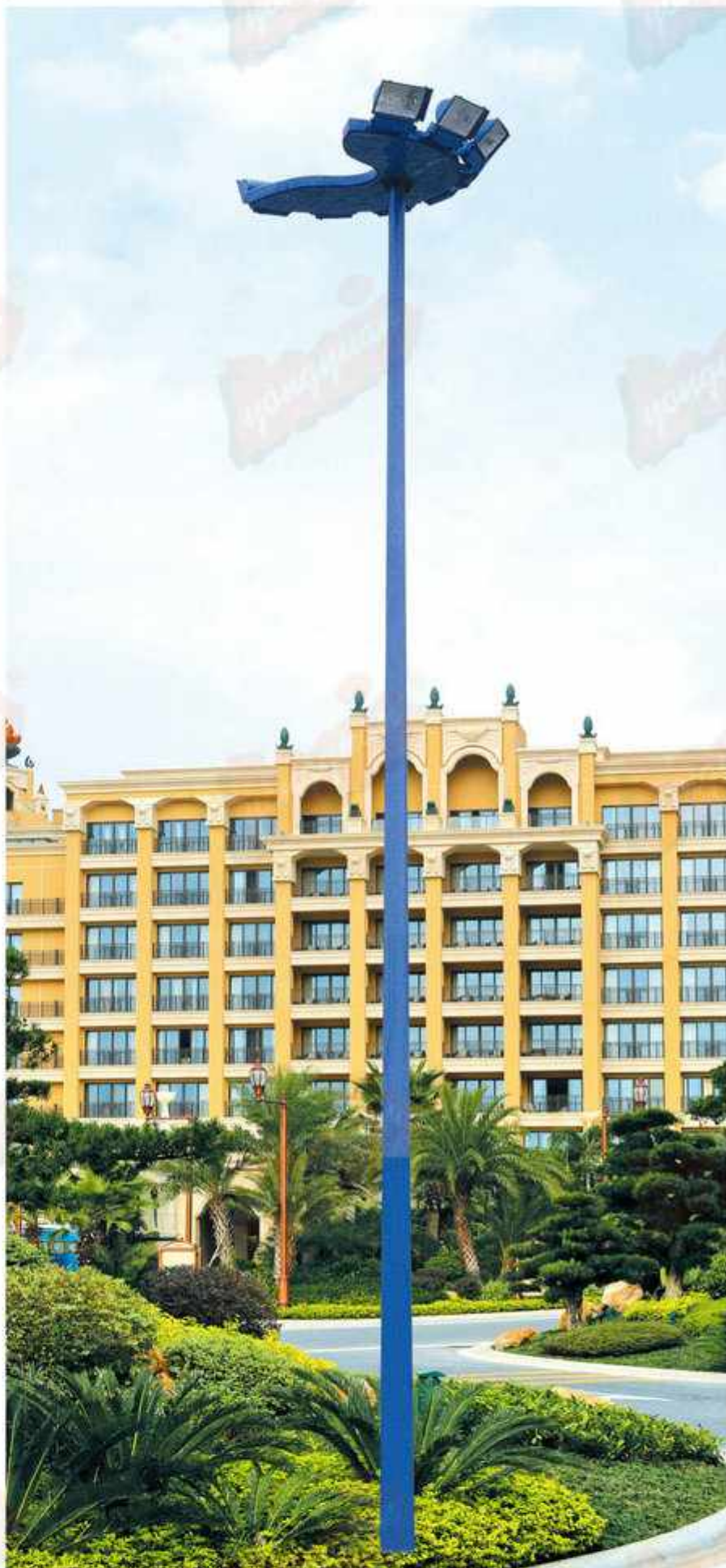
型号：永安名牌2019A55 技术参数：总高12-18m，钢铁制品；灯具铝制品，配400w-1000w高压钠灯，金卤灯或LED光源，全套内外热浸锌防腐处理后喷优质户外氟碳漆，具体技术规范根据安装地域的抗风等级及地震烈度设防度的要求。