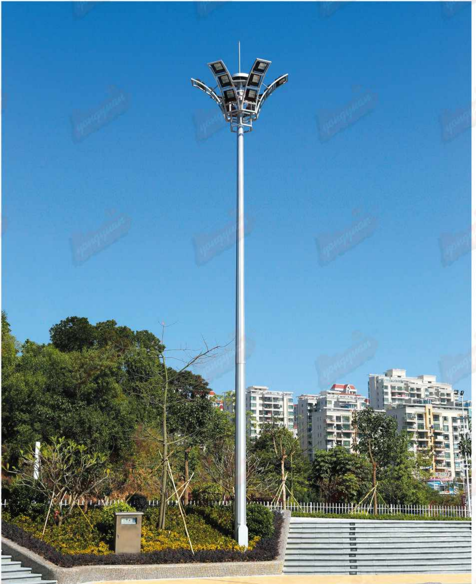
型号：永安名牌2019A82 技术参数：总高18-30m，钢铁制品；灯具铝制品，配400w-1000w高压钠灯，金卤灯或LED光源，全套内外热浸锌防腐处理后喷优质户外氟碳漆，配置高杆灯专用自动升降系统，配钢丝绳、电缆线、地基螺丝及提供安装技术指导，具体技术规范根据安装地域的抗风等级及地震烈度设防度的要求。