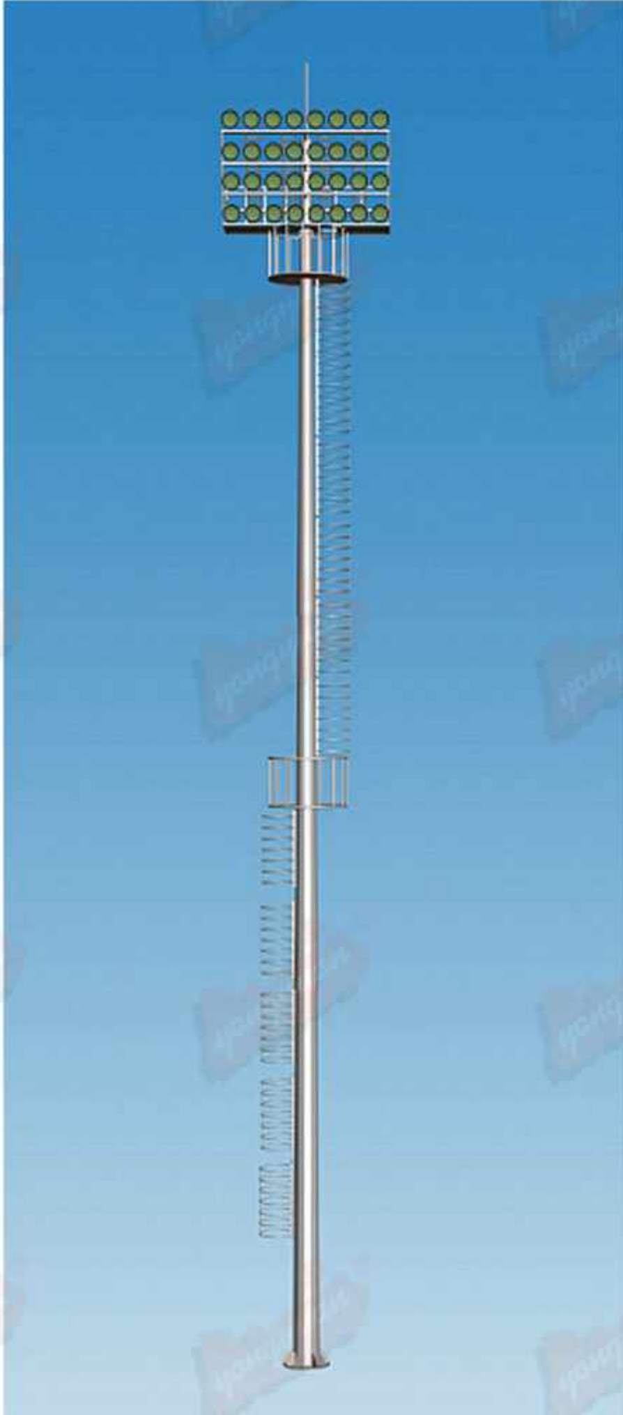
型号：永安名牌2019A52 技术参数：总高18-30m，钢铁制品；灯具铝制品，配400w-1000w高压钠灯，金卤灯或LED光源，全套内外热浸锌防腐处理后喷优质户外氟碳漆，具体技术规范根据安装地域的抗风等级及地震烈度设防度的要求。