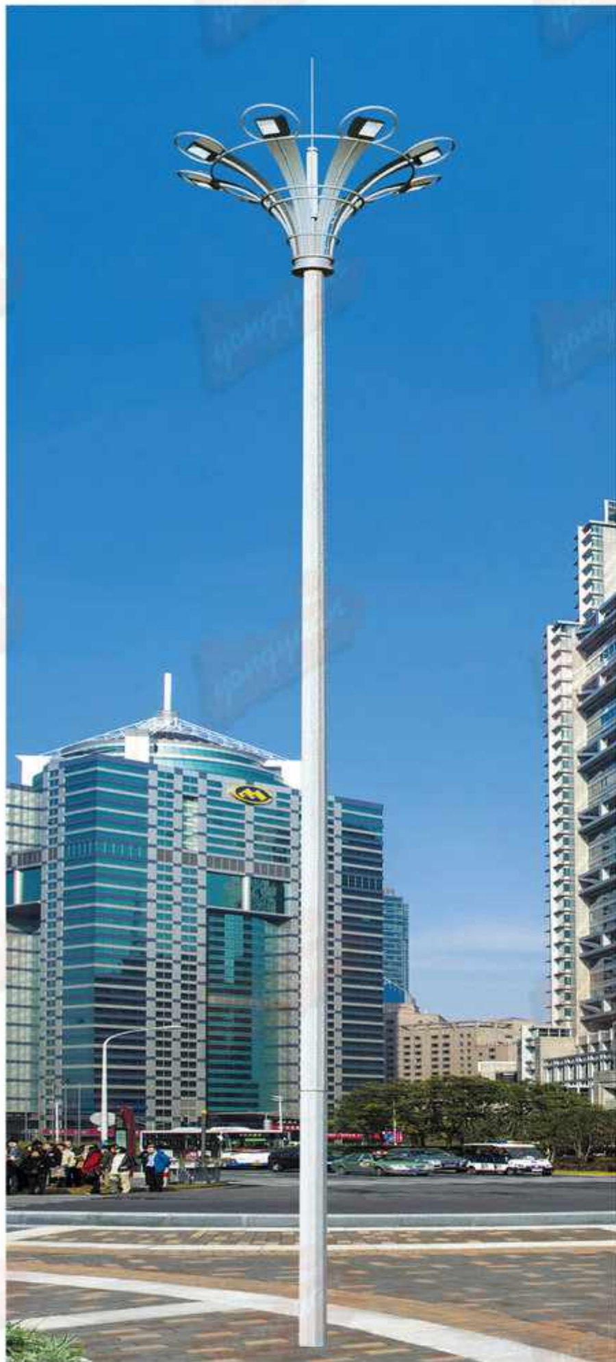
型号：永安名牌2019A21 技术参数：总高12-18m，钢铁制品；灯具铝制品，配400w-1000w高压钠灯，金卤灯或LED光源，全套内外热浸锌防腐处理后喷优质户外氟碳漆，具体技术规范根据安装地域的抗风等级及地震烈度设防度的要求。