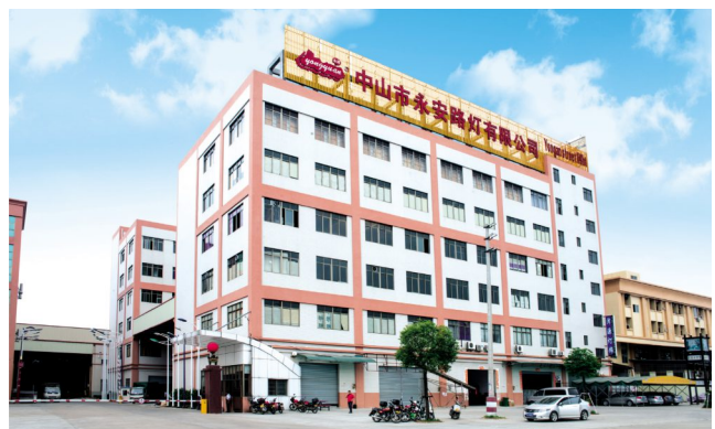
Yongan Office Area