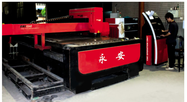
Laser cutting workshop