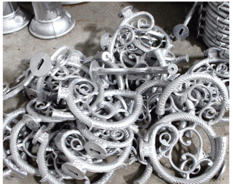
High Pressure Casting workshop