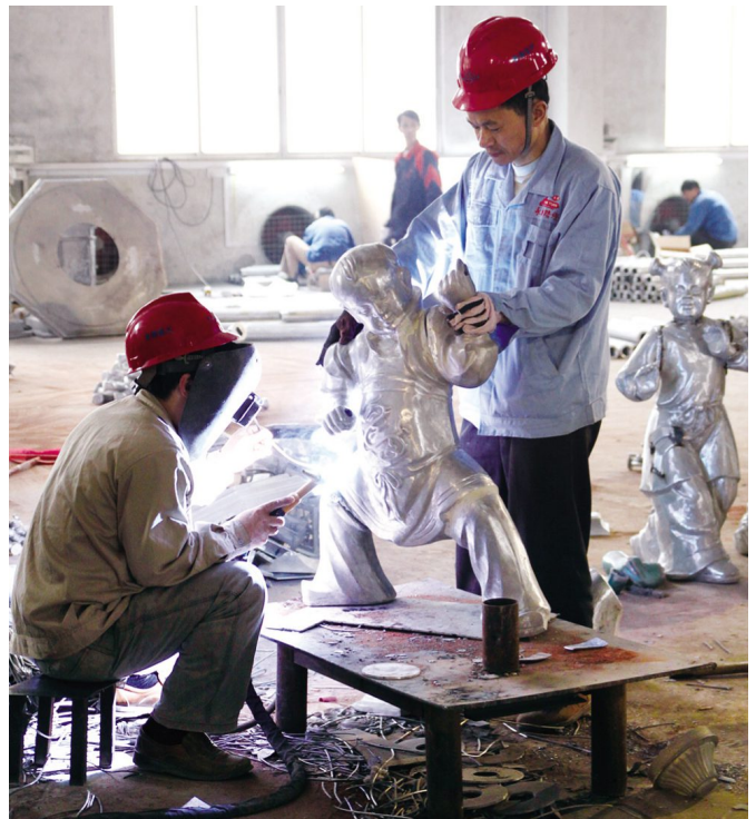
Hardware processing workshop