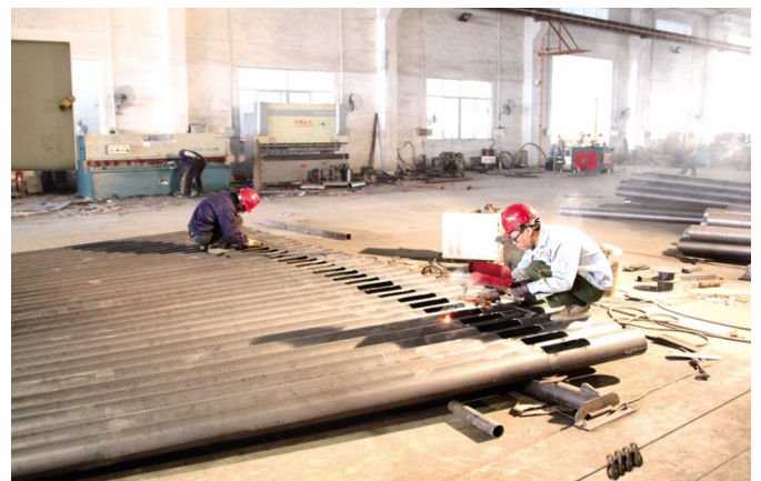
Conical rod workshop