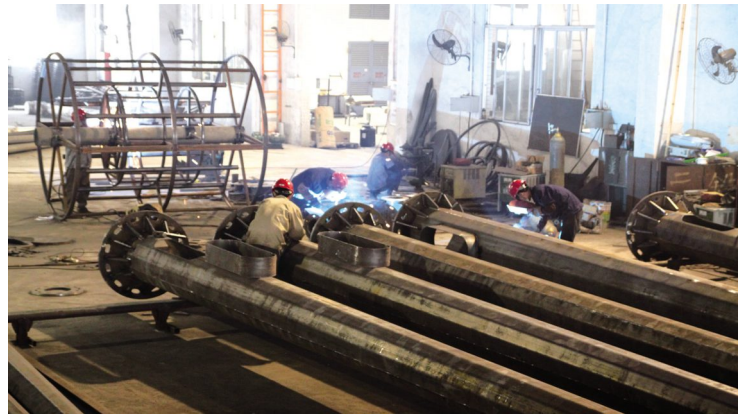
Street lamp workshop